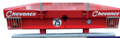
Feux leds protégés