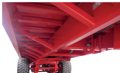
Jambes de force et renforts sur longerons de châssis