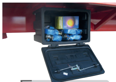
Coffre de rangement avec sangles de série