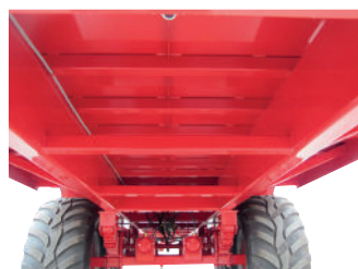
Traverses de fond très rapprochées