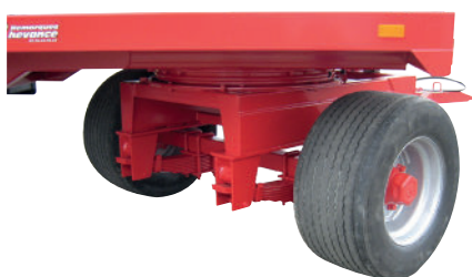
Rond d'avant-train diam. 1108 mm sur MOVITRAC 260