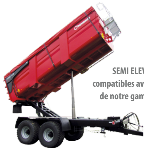
SEMI ELEVATRICES compatibles avec les produits de notre gamme FARMER