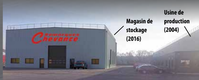
Magasin de stockage (2016)

Z. I. DE GRACES - 22200 GUINGAMP Tél. : 02 96 43 40 62 - Fax : 02 96 43 66 57 com@remorques-chevance.eu