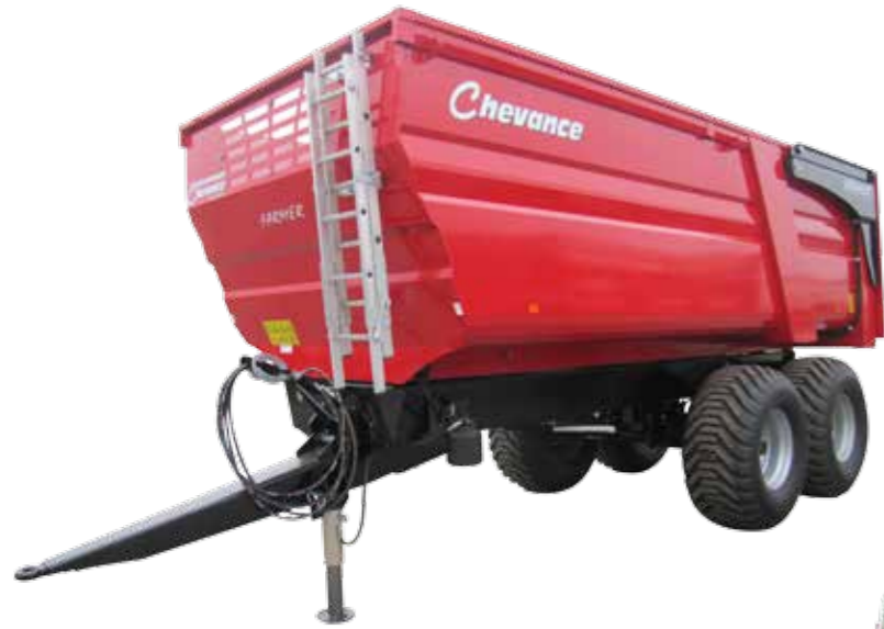
FARMER 130 (1,50m) – 18,5/27,5 m 3

Circuit hydraulique en acier zingué, fixé sur plots