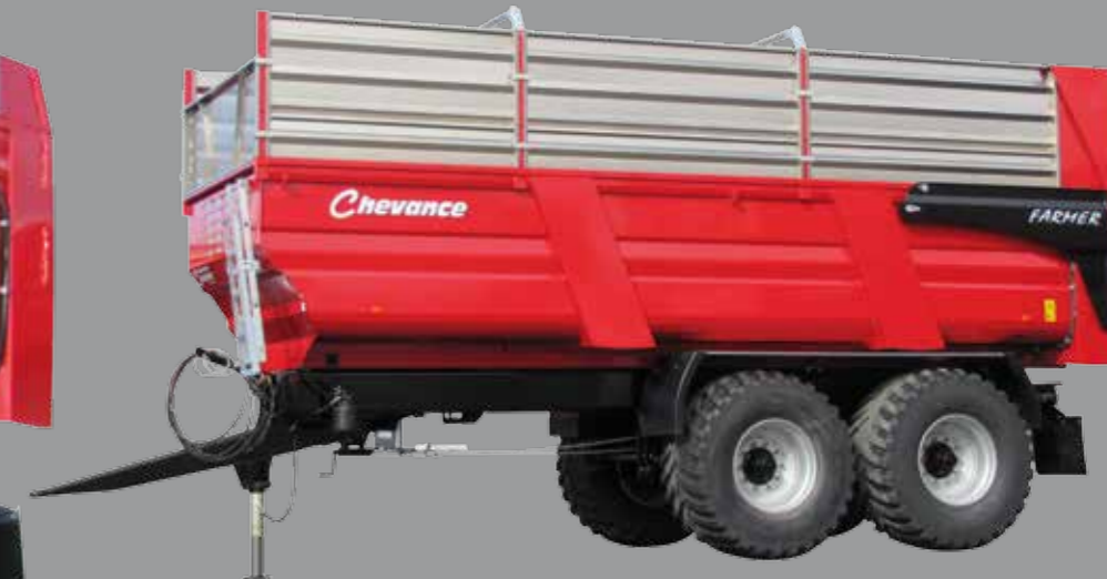
FARMER 180 (1,50m) - 24/35,5 m 3