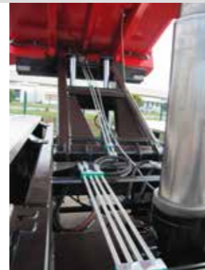
Trappes à grains en inox équipées de levier à manœuvre du sol Hauteur 2,40 m (en fonction des pneumatiques)