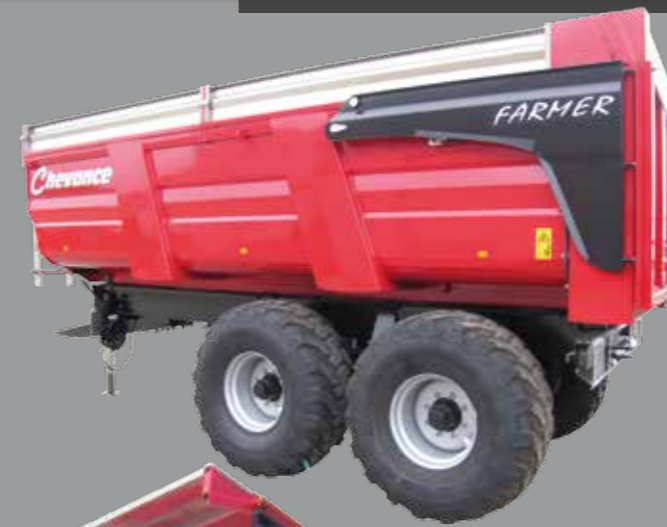
FARMER 150 (1,20m) - 16/30,5 m 3

Essieux Colaert capacité de charge accrue Souplesse du véhicule Meilleur rendement au freinage